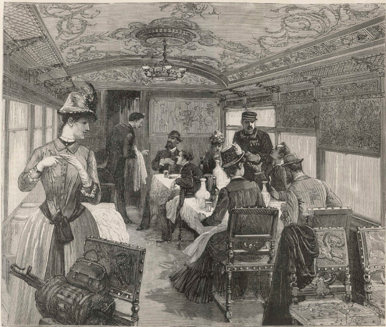
VUE INTÉRIEURE D'UN WAGON-RESTAURANT