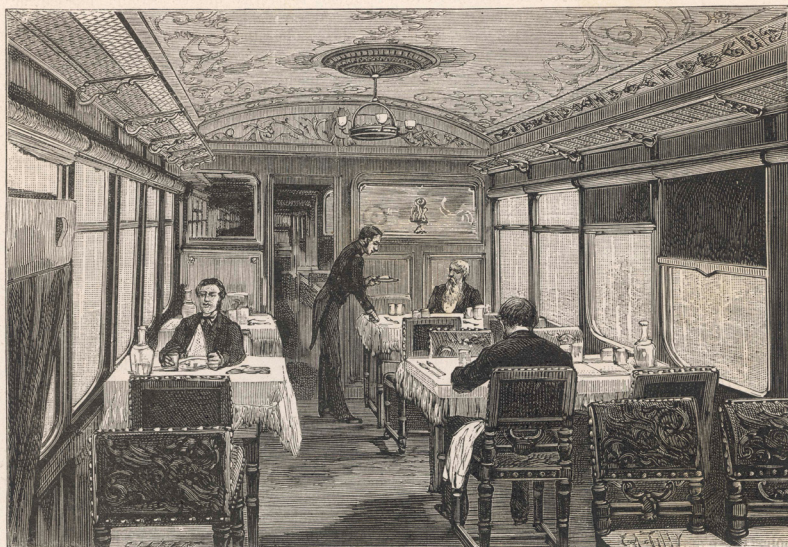
Fig. 1. — Vue intérieure de la salle à manger de l'Orient-Express.

Willkommen im goldenen Zeitalter des Reisens König der Züge und Zug der Könige